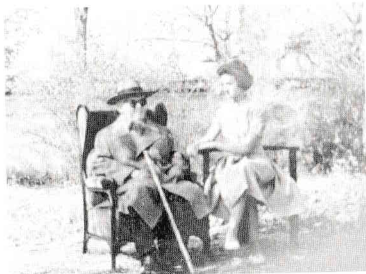
Cu Sadoveanu în ultima sa lună de viață

Pe treptele terasei, povesteam păpușii mele istoria care îmi trecea prin cap în acel moment. Era vorba de o bătrână singură. În lipsă de copil, creștea lângă ea o rămă căreia îi povestea vrute și nevrute. Râma creștea văzând cu ochii. Când avea capul prea plin de palavre, râma scotea la iveală un al doilea cap, apoi un al treilea... până când