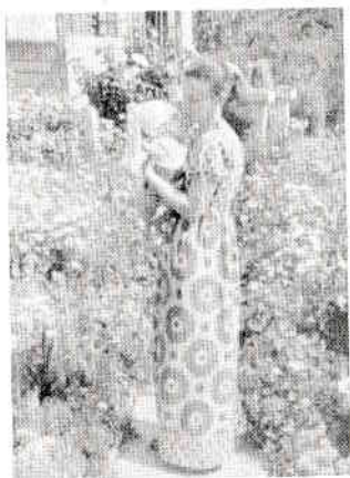
Văratec, iunie 1978

Aducerea pe lume a copilului meu s-a înfăptuit în condiții deosebit de vitrege. Când, pe patul de spital, am întredeschis pleoapele, după nu știu câte zile și nopți ucigătoare, m-au întâmpinat doi ochi negri, catifelati și luminoși.