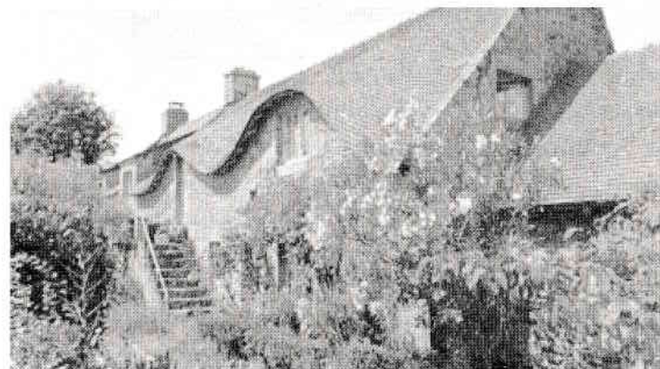
Casă din St. Pierre (Kerhostin)